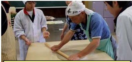
人気のそば打ち体験

魅力いっぱいの体験施設から総合学習・生涯学習体験支援プランの提供です！修学旅行にもいかがですか？