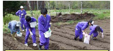
食育の一環です。農業体験