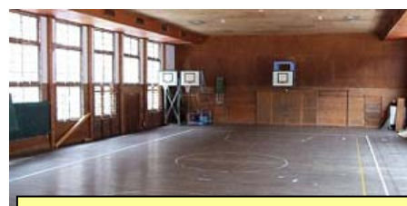
懐かしの木造の体育館