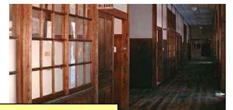
昭和時代の図工室