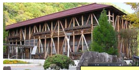
昭和の学校校舎で満喫体験