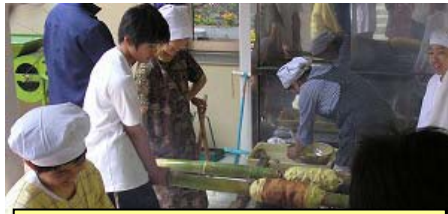
竹を利用して作るバームクーヘン