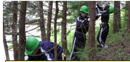
林業を通じて山の役割を学ぶ